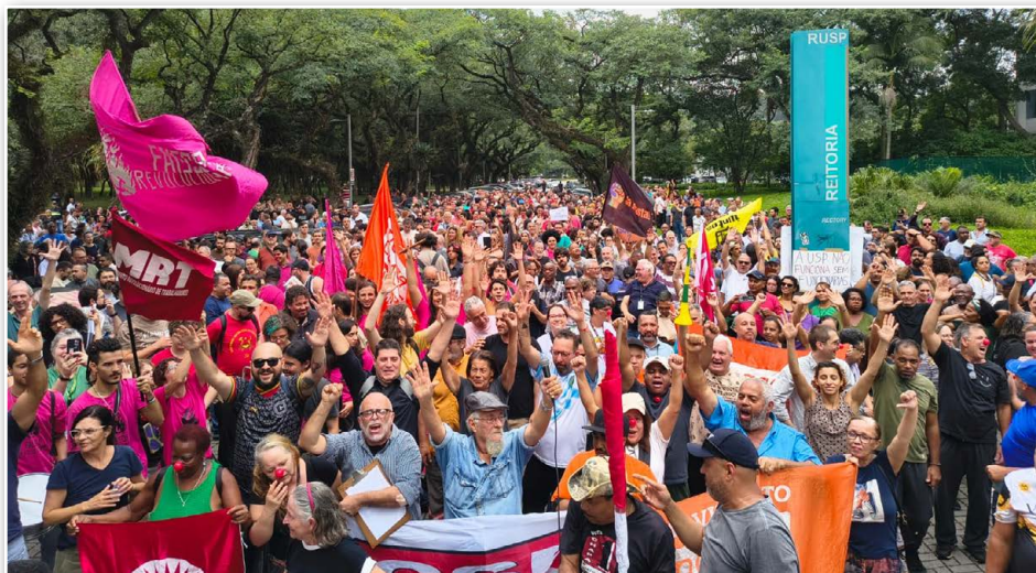
Ato dos servidores técnico-administrativos da USP em 31/3, em frente à reitoria

Em nota à categoria, a Adusp pontuou que, “à primeira vista, bônus e gratificações podem parecer positivos — especialmente em um contexto de arrocho salarial e sobrecarga de trabalho”, e que nos últimos anos essas políticas vêm sendo apresentadas como forma de “valorização” da carreira.