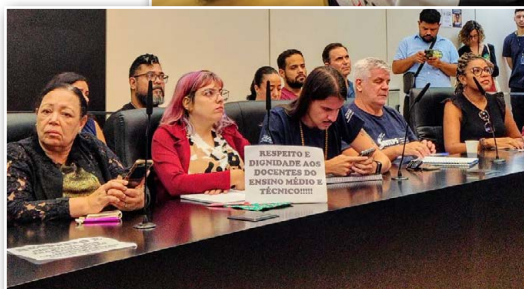
A audiência pública na Alesp, em 17/3