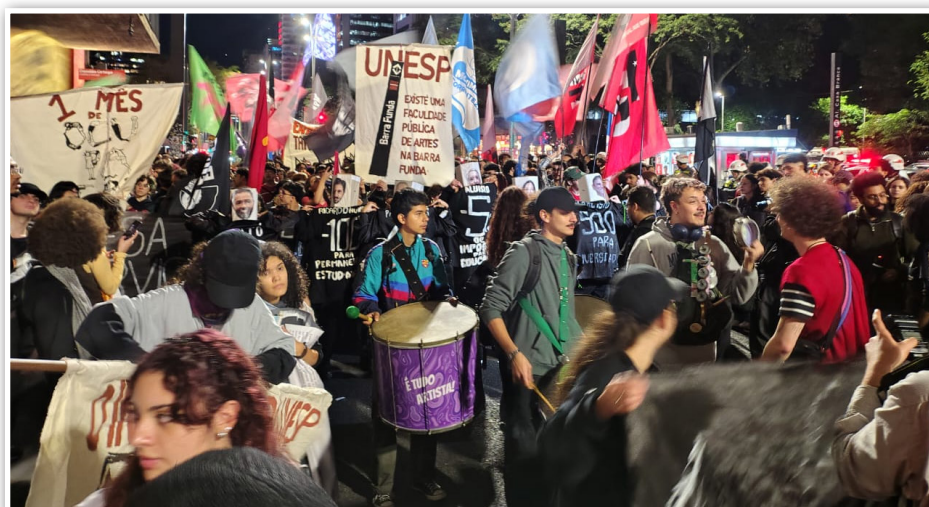
Marcha à Alesp, em 17/6/2026: A defesa da educação pública ganha as ruas

Também não avançamos na discussão do financiamento no atual cenário de reforma tributária, ponto de suma importância devido à necessidade de estabelecer novos